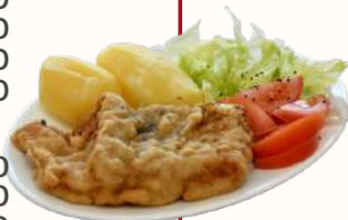
Filete de congrio de 260 gramos