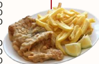
Filete de merluza de 280 gramos