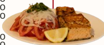
Filete de salmón de 260 gramos

*Todas las preparaciones de pescados a Plancha tienen el mismo valor que a la Mantequilla